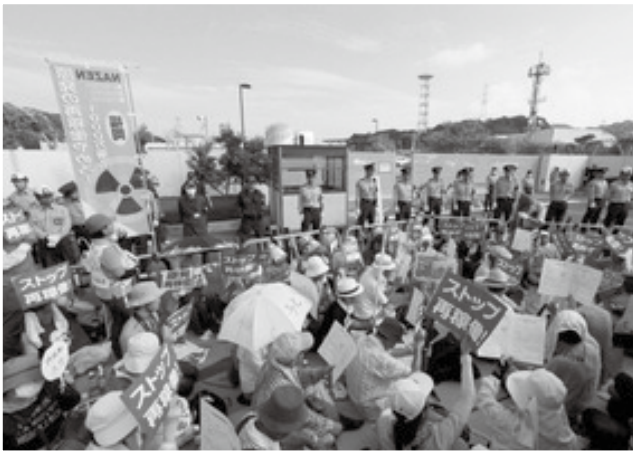
川内原発ゲート前・再稼働に抗議する人びと