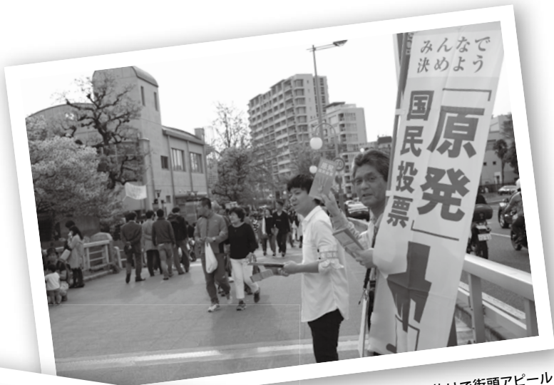
大阪造幣局桜の通り抜けて街頭アピール