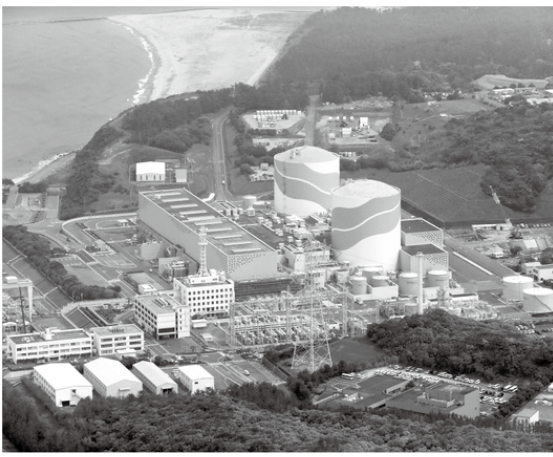
川内原発(鹿児島県薩摩川内市)