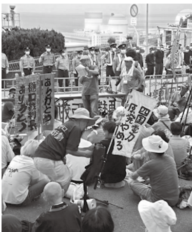
伊方原発前で再稼働に抗議する人びと