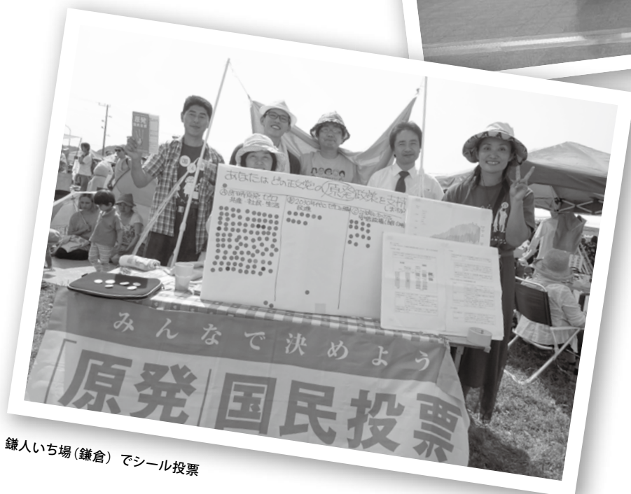
鎌人いち場(鎌倉)でシール投票