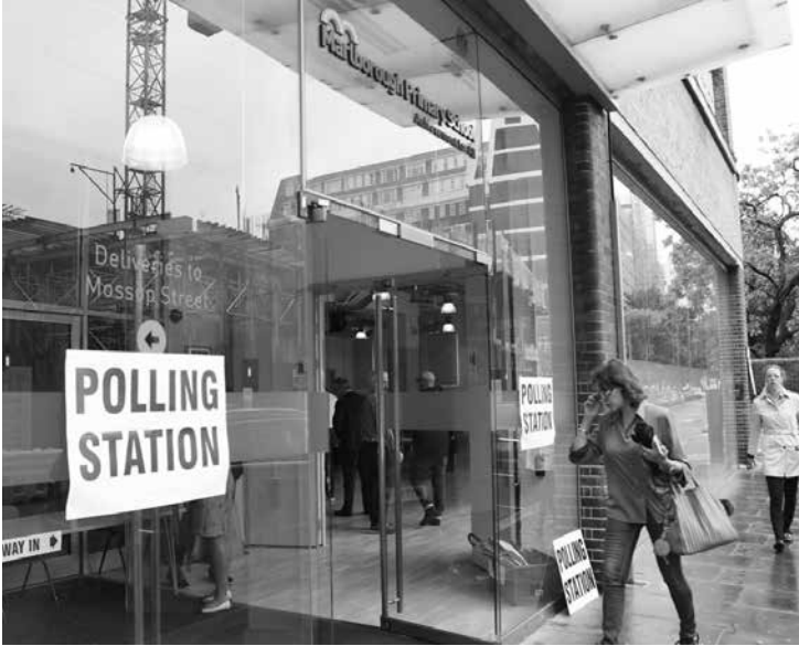
当日の投票所(ロンドン)